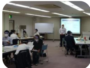
グループワーク (フェイスシールド着用)