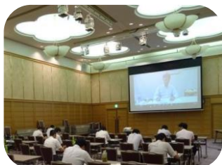
講師リモート参加による研究会