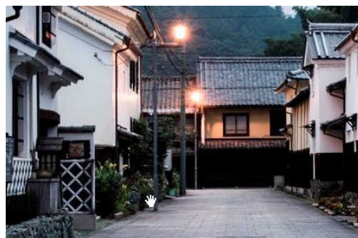
【歴史的資源を活かした新たな地域ビジネス】

また、 香川大学イノベーションデザイン研究所の協力のもと、当研究会会員に対して、事業開発に関する個別相談、協業支援 を行います。