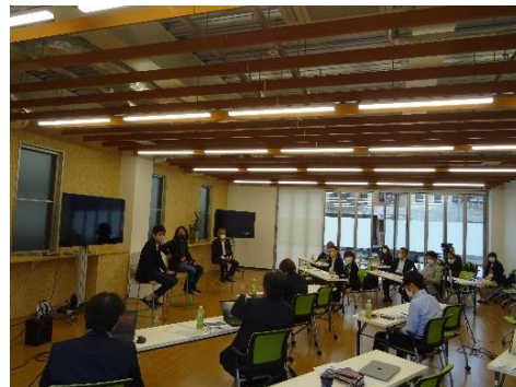
定例会の風景(香川大学イノベーションデザイン研究所)

香川大学イノベーションデザイン研究所の協力のもと、当研究会会員に対して、事業開発に関する個別相談、協業支援を行います。