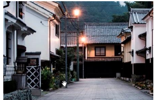
【歴史的資源を活かした新たな地域ビジネス】

また、 香川大学イノベーションデザイン研究所の協力のもと、当研究会会員に対して、事業開発に関する個別相談、協業支援を行います。