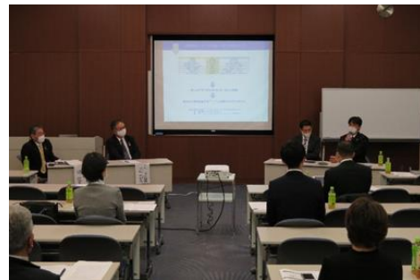
【座談会の風景（2021年度実施）】

また、 香川大学イノベーションデザイン研究所の協力のもと、当研究会会員に対して、事業開発に関する個別相談、協業支援を行います。